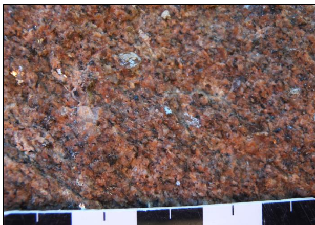
Granite à grain fin de Brignogan, faciès de Cléder.