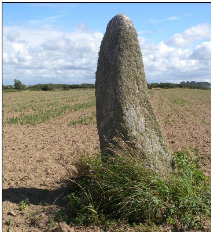
★ Menhir de Kervizouarn, Kerlouan.