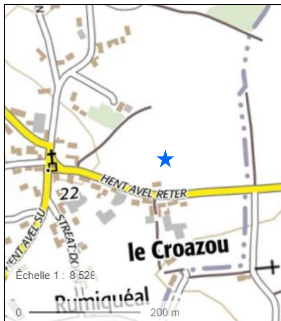
Menhir disparu du Croazou, Kerlouan.

A 200 m à l'est de la chapelle du Croazou, ce menhir, aujourd'hui disparu, mesurait 3,20 de haut. E. Morel en a réalisé deux dessin. Il précise qu'il se trouvait à 40 m environ au nord de la maison orientale du village et à 200 m du chemin de Minioc. Il a été détruit à la fin des années 1920 ou dans les années 1930 (SPARFEL, PAILLER & alii 2009).